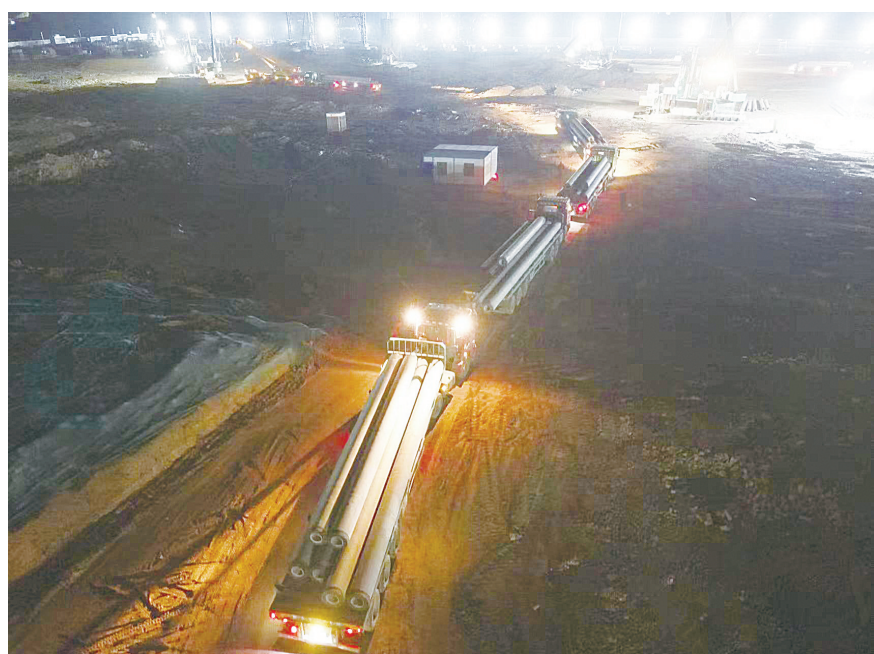
凌晨三点,智能液压挖掘机项目现场,运满管桩的货车正在排队卸车

自进场之日起,售后服务工部项目负责人就每天在安装现场来回奔波,积极协调厂内缺件发货,确保到货及时,与矿方各方面协调确保安装顺利进行。现场安装的工人师傅严格按照图纸施工,提前介入、提前准备、提前控制,发现问题及时与技术人员沟通,确保安装质量和进度。质检员严把安装质量,做好每个安装部位的质量把控。调试人员仔细校对,优化程序参数,对设备进行精调优化,精益求精, (下转第二版)