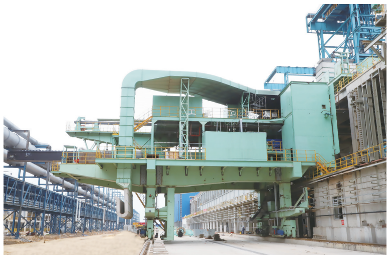
公司自主研发生产的7.3m智能焦炉设备填补了我国大型焦炉设备绿色化、智能化空白

太原日报社主办的《光影太原》官微以《“智造”强国在路上》为题,用28张摄影美图对太重“智造”发展之路进行了专题报道。文中提到,在“工业大国”迈向“工业强国”的新征程上,太重集团凭先进技术之力,走前人没走过的路,闯别人没闯过的关,用创新赢得“话语权”,使“中国制造”成为世界市场上的闪亮“名片”。